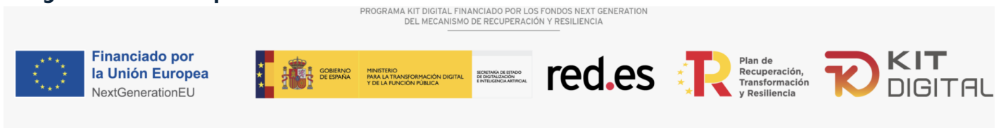
Imagen fondos europeos sin texto alternativo

La imagen de los fondos de la unión europea tiene el texto alternativo vacío, recomendamos poner 'Financiado por la Unión Europea a partir de los fondos Next Generations del plan de Recuperación y Resiliencia'