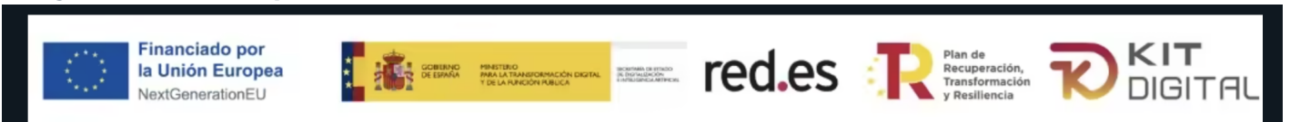
Imagen fondos europeos con texto alternativo erróneo

La imagen de los fondos de la unión europea tiene el texto alternativo excesivamente genérico, recomendamos poner 'Financiado por la Unión Europea a partir de los fondos Next Generations del plan de Recuperación y Resiliencia'